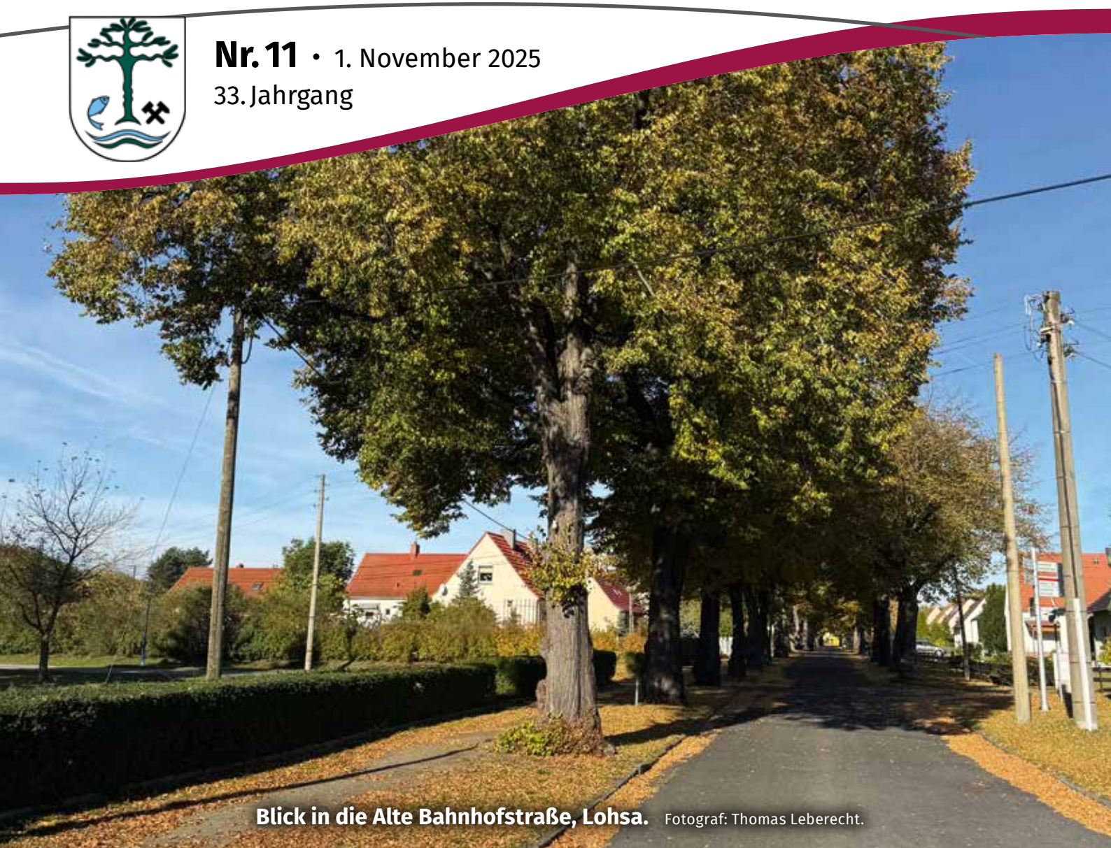
Blick in die Alte Bahnhofstraße, Lohsa.