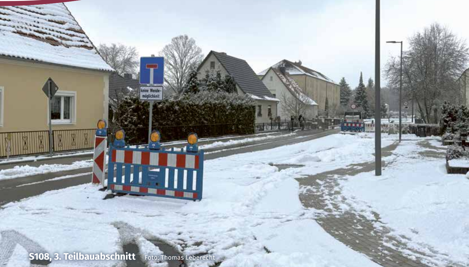
S108, 3. Teilbauabschnitt