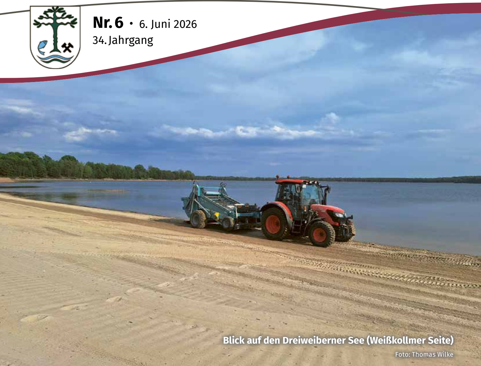
Blick auf den Dreiweibener See (Weißkollmer Seite)