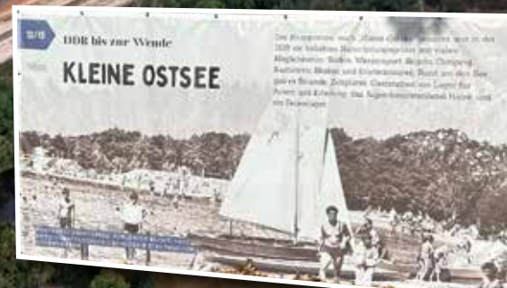
Banner anlässlich der Ausstellung in der Energiefabrik