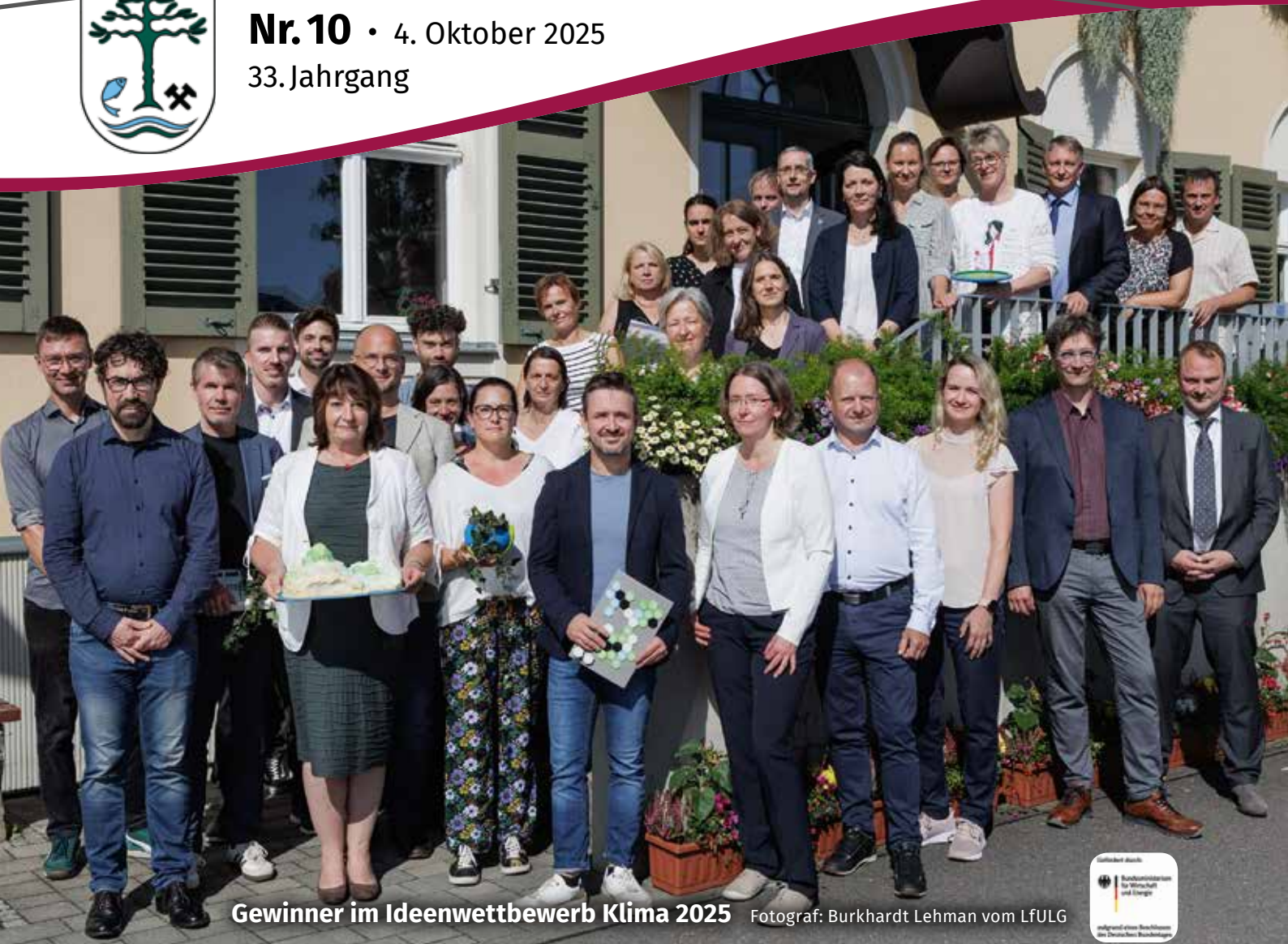
Gewinner im Ideenwettbewerb Klima 2025