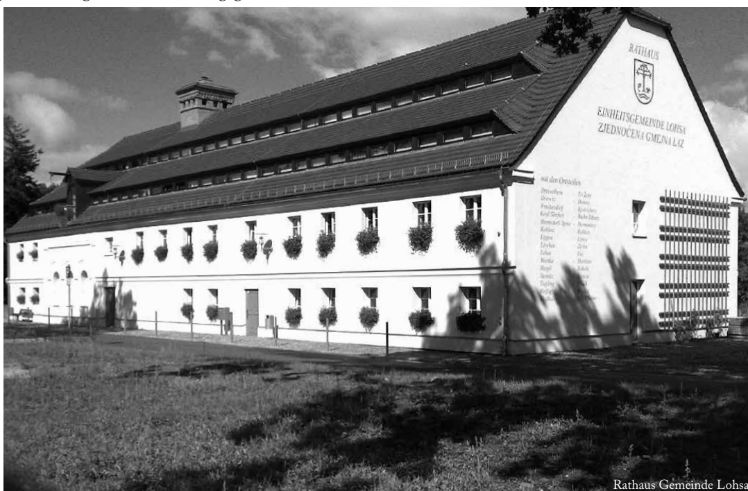
Rathaus Gemeinde Lohsa