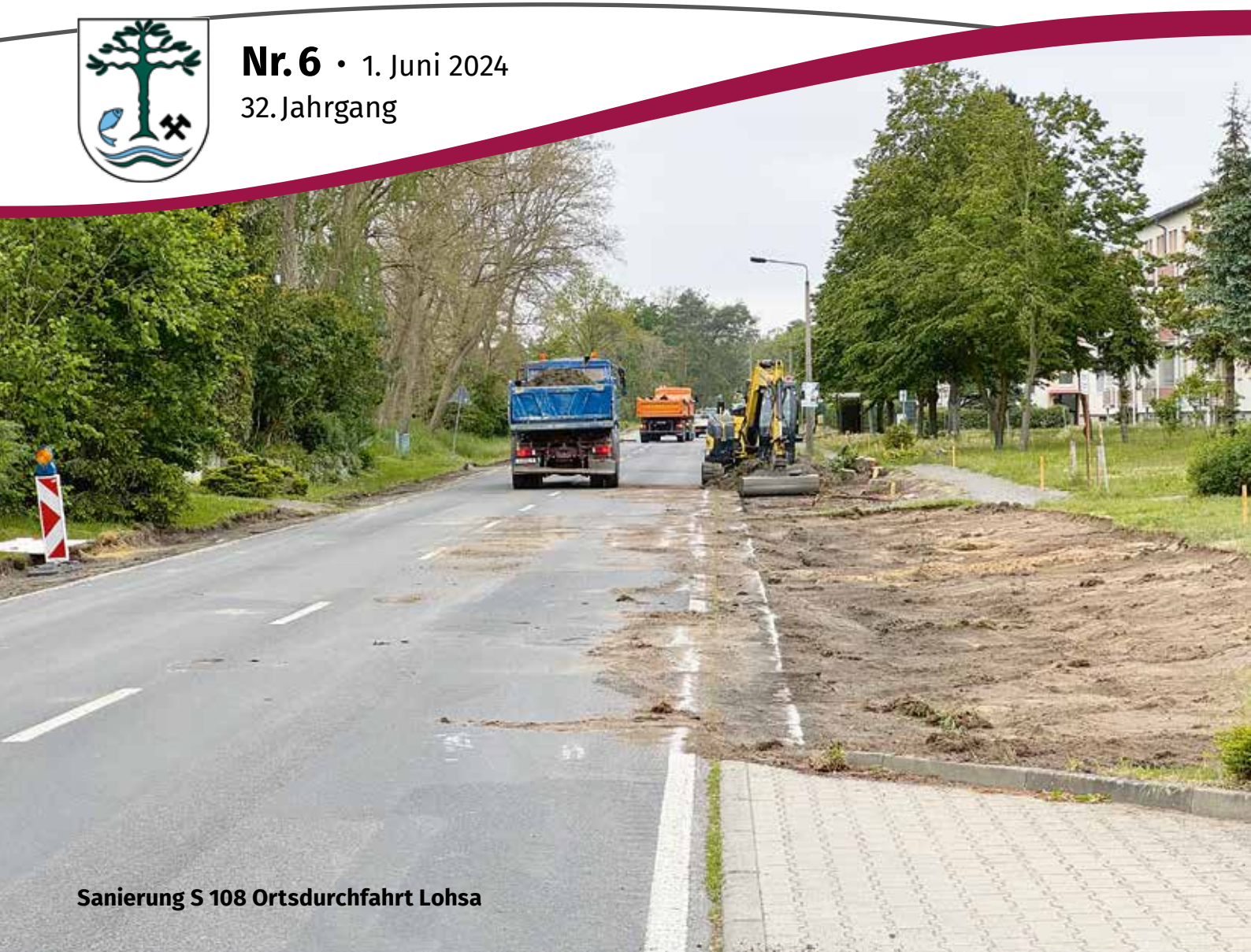
Sanierung S 108 Ortsdurchfahrt Lohsa