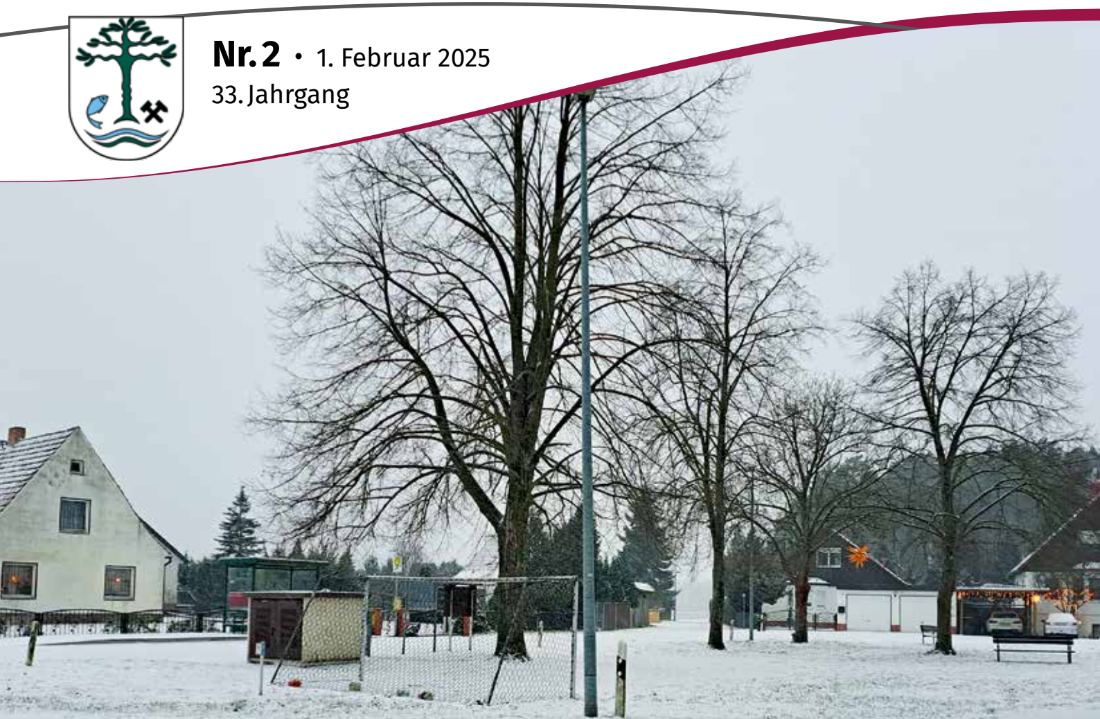
Erster Schnee in Tiegling